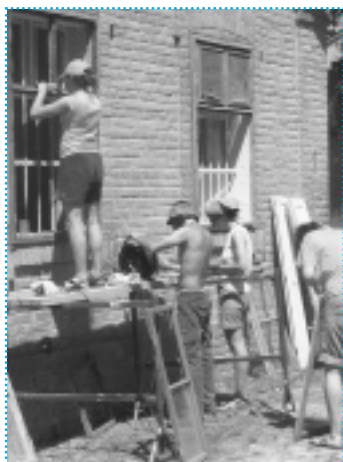
>> Volonteri uređuju društveni dom u Slavoniji