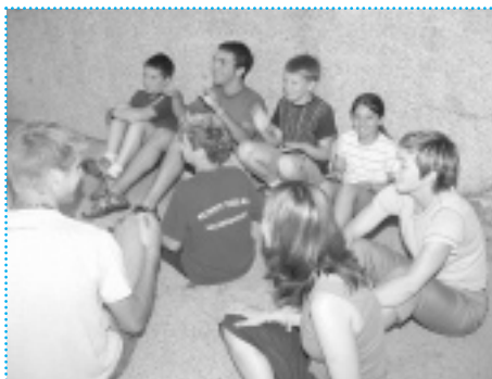
>> Radionica u organizaciji udruge Hyper

Hyper je uz pomoć CroNGO-a pristupio jačanju organizacijskih kapaciteta, što im je pomoglo da uspješno završe uređivanje Doma i ojačaju funkcioniranje unutar organizacije. Sada Hyper ima formalnu strukturu, a dva puta tjedno održavaju sastanke sa svojim članovima gdje se dogovaraju o zadacima i aktivnostima u nadolazećem tjednu. Također su razvili plan budućih aktivnosti i surađuju s lokalnim partnerima na njihovom ostvarivanju. Članovi udruge navode da je otvaranje Doma za mlade popravilo njihov ugled u zajednici i da sada građani imaju dobro mišljenje o njihovim aktivnostima. Partnerska suradnja s gradskom vlasti i Podravkom koja je uspostavljena za vrijeme trajanja CroNGO potpore i dalje se nastavlja. Za buduće aktivnosti udruga treba dobiti financijsku potporu i donaciju u robi i uslugama od oba partnera.