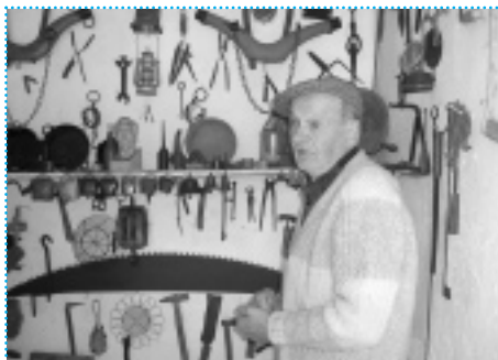
>> Etno zbirka starog oruđa koje je otvorio jedan mještаниn u blizini staze

Nakon završetka CroNGO potpore, udruga je započela sljedeću fazu projekta. Danas članovi udruge rade prema popisu prioriteta i budućih aktivnosti koje uključuje izradu promotivnih materijala za turiste, obučavanje mještana kako raditi kao turistički vodiči te sakupljanje priča iz tog kraja koje bi bile zanimljive turistima. Prema postignutim rezultatima možemo zaključiti da će Prezid sljedećih nekoliko godina postati popularno turističko odredište. <<