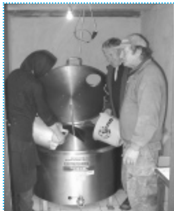
>> Mještani Berka sakupljaju mlijeko u novom laktofrizu

Prvi korak koji su poduzeli bilo je registriranje udruge pod nazivom Udruga proizvođača mlijeka Berak. Sljedeća aktivnost bila je stvaranje strojnog prstena u koji svaki član udruge donira materijal ili stroj koji služi za zajednički upotrebu. Nakon toga, udruga je predala zahtjev Vladi Republike Hrvatske da im dodijeli zemlju koja bi se upotrebljavala za proizvodnju mlijeka. Ako uspiju, to bi navelo mnoge mještane da se priključe udruzi i koriste se opremom, zemljištem i uspostavljenim poslovnim kontaktima. Ove akcije promovirale su udruhu u zajednici i motivirale ostale da se priključe.