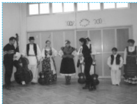
>> Predstavljanje obnovljenih nošnji članovima zajednice u Osnovnoj školi Stara Gradiška

Uspjeh ovog projekta pomogao je udruzi da stekne ugled kao jedan od malobrojnih organizatora kulturnih i društvenih programa u regiji. Tražili su od mještana da otvore stare škrinje i potraže narodne nošnje i glazbala kako bi ih spasili od zaborava, ali nakon što su ih jednom otvorili, KUD Posavina i zajednica dobili su mnogo više nego što su očekivali. <<