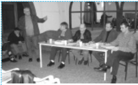
<< Udruga za informatičku djelatnost Portal Alfa otvorila je Info centar u zajednici uz potporu CroNGO programa, lokalnih vlasti i poduzetnika.

poduzetnici podržali su projekte financijskim priložima, donacijama u materijalu ili radu te uslugama prijevoza. Lokalne ustanove poput škola, muzeja, knjižnica i centara socijalne skrbi dali su svoje vrijeme i stručnost u podučavanju volontera i članova inicijative. Ovakva lokalna partnerstva odigrala su važnu ulogu u svih pet primjera opisanih u ovoj brošuri.