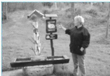
>> Postavljene oznake služe turistima za orijentiranje po stazi

Zbog dobrih rezultata projekta, lokalne vlasti sada smatraju udrugu Trbuhovica ravnopravnim partnerom u poticanju razvoja prezidskog kraja. Gradonačelnik Čabra istaknuo je: 'Grad podupire napore Trbuhovice te im pruža svu potrebnu pomoć. Zahvaljujući udruzi, Prezid je sada divno turističko mjesto.'